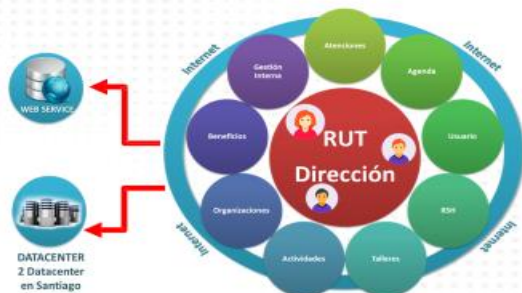
Renovación año 2019-2020