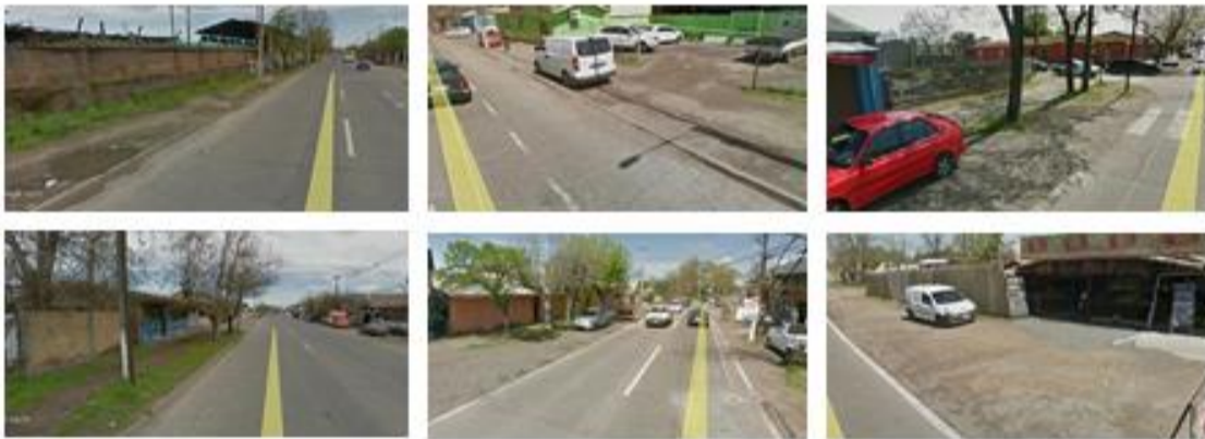
IMÁGENES SITUACIÓN ACTUAL