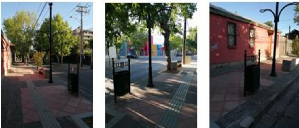
IMÁGENES SITUACIÓN DE VEREDAS PROYECTADO