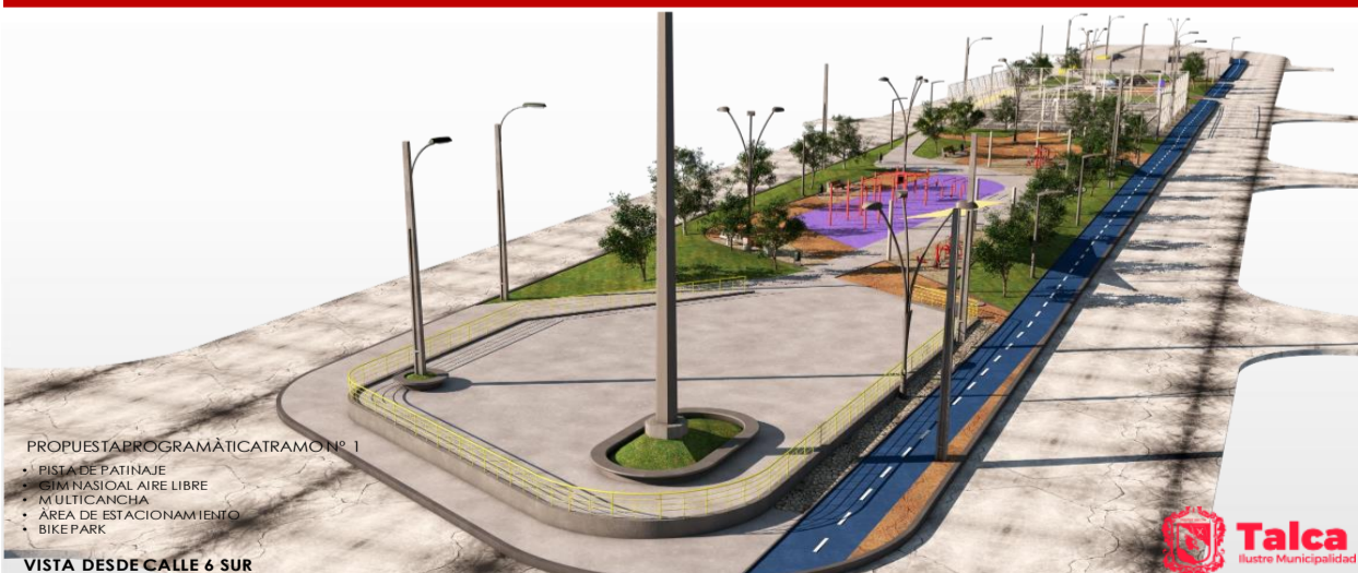
VISTA DESDE CALLE 6 SUR