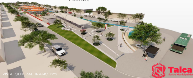
VISTA GENERAL TRAMO N°2