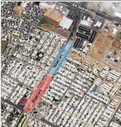
IMAGEN DEUBICACIÓN PROYECTO