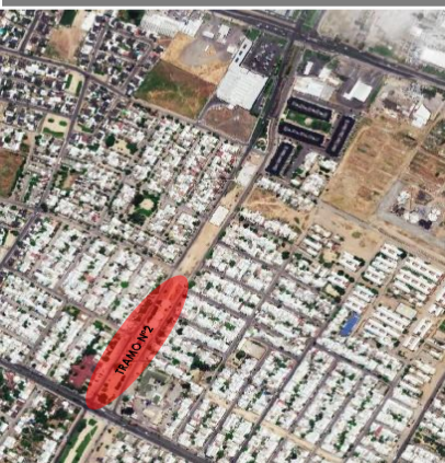
PLANTA PROGRAMÁTICA TRAMO N° 2

PROYECTO:MEJORAMIENTOBANDEJON30 ORIENTE ENTRE CALLES 4 Y 8 SUR,TALCA