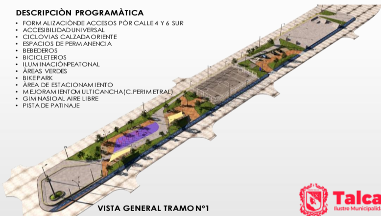
VISTA GENERAL TRAMO N°1