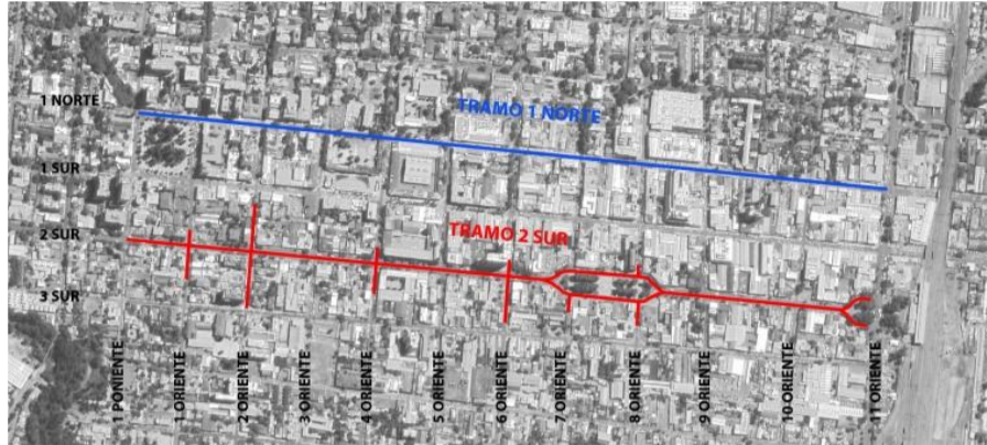
IMAGEN SATELITAL CENTRO DE TALCA