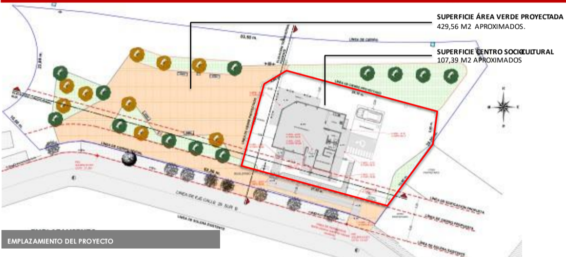
EMPLAZAMIENTO DEL PROYECTO