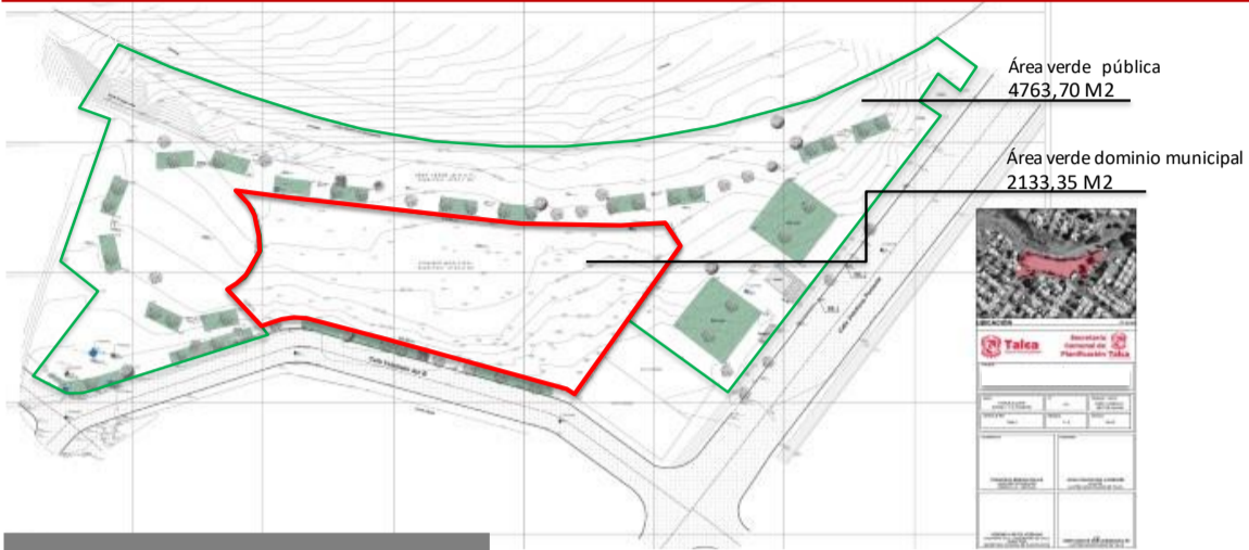
SITUACIÓN ACTUAL DEL TERRENO A INTERVENIR