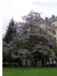
Paulonia (exótica) [Paulownia tomentosa]