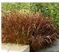
Penisetum rojo [Pennisetum rubrum]