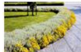
Santolina [Santolina chamaecyparissus]