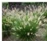
Penisetum [Pennisetum setaceum]