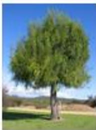
Malten (nativo prop. Ord.) [Maytenus boaria]