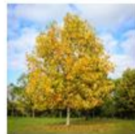
Tullpero (exótica prop. Ord.) [Paulownia tomentosa]