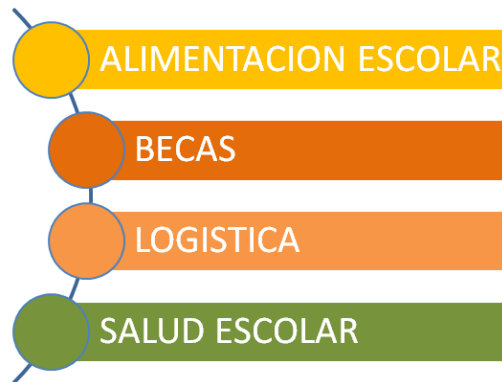
PROGRAMAS REGULARES JUNAEB IMPLEMENTACION POR GRUPOS ETÁREOS PRESENCIA EN TODO EL CICLO EDUCATIVO