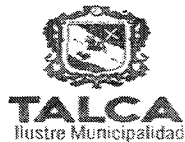
TABLA SESION EXTRAORDINARIA CONCEJO COMUNA DE TALCA JUEVES 28 de ENERO de 2016 - 11:00 HORAS