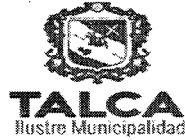
TABLA COMPLEMENTARIA SESION ORDINARIA CONCEJO COMUNA DE TALCA

MARTES 12 DE JULIO DE 2016 - 16:00 HORAS