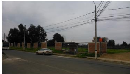
Calle 13 ½ Oriente con Calles 21 Norte A y 22 Norte, Villa Don Horacio