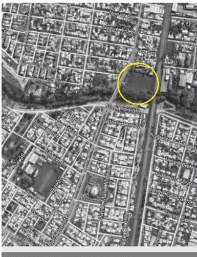
IMAGEN DE UBICACIÓN PROYECTO