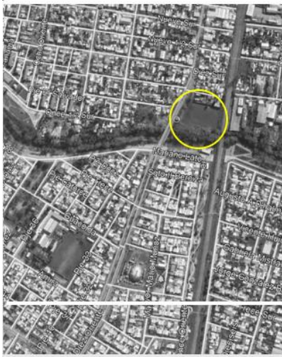
IMAGEN DE UBICACIÓN PROYECTO