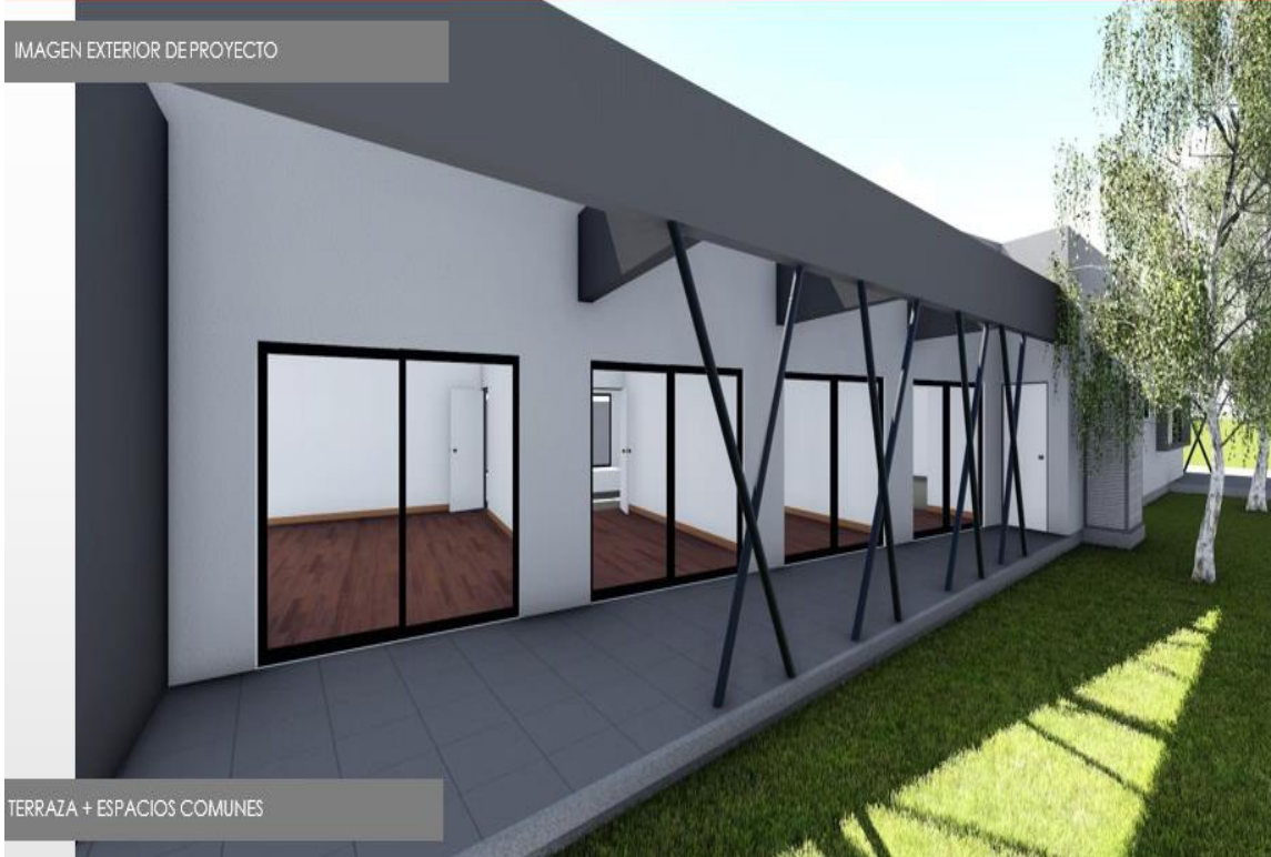
TERRAZA + ESPACIOS COMUNES