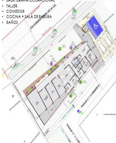
PROGRAMA ARQUITECTONICO + ARQUITECTURA