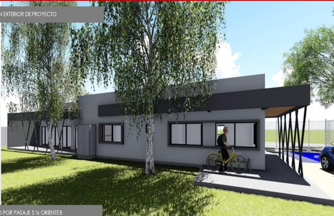
ACCESO POR PASAJE 5 1/2 ORIENTE B