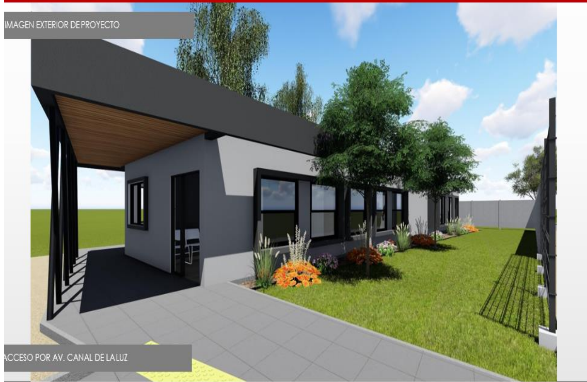
ACCESO POR AV. CANAL DE LALUZ