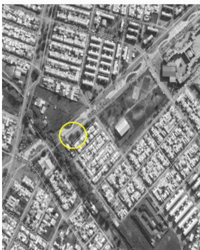
IMAGEN DE UBICACIÓN PROYECTO