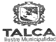
TABLA COMPLEMENTARIA CONCEJO COMUNA DE TALCA

MARTES 14 DE ABRIL DEL 2020 - 09:00 HORAS