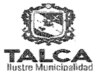
TABLA COMPLEMENTARIA CONCEJO COMUNA DE TALCA

MARTES 14 DE ABRIL DEL 2020 - 09:00 HORAS