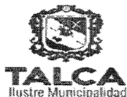
TABLA COMPLEMENTARIA SESION ORDINARIA DE CONCEJO COMUNA DE TALCA

MARTES 07 DE JULIO DEL 2020 - 09:00 HORAS