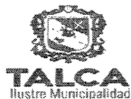
TABLA COMPLEMENTARIA SESION ORDINARIA DE CONCEJO COMUNA DE TALCA

MARTES 21 DE JULIO DEL 2020 - 09:00 HORAS