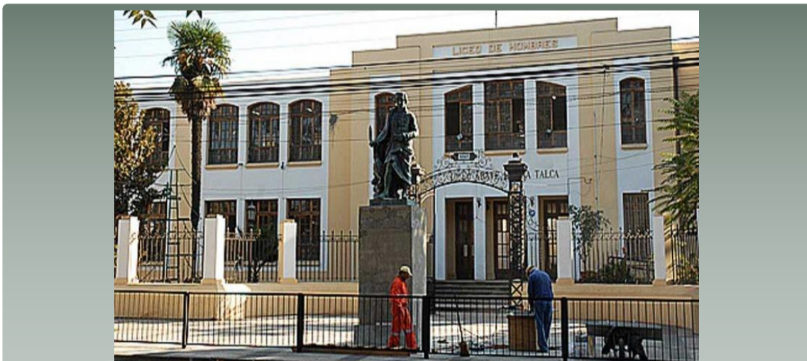
Mejoramiento SSHH Varones Liceo Abate Molina