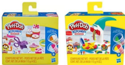
PLAY-DOH KITCHEN CREATIONS MINISSET DE COMIDA F3159

Creaciones de cocina Play-Doh Juego de fideos Lil' para niños de 3 años en adelante con 2 latas compuestas de modelado no tóxico de dos colores. Los futuros chefs pueden preparar un plato de pasta imaginaria con este set Play-Doh Kitchen Creations.