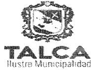
TABLA COMPLEMENTARIA SESION ORDINARIA CONCEJO COMUNA DE TALCA

MARTES 27 DE SEPTIEMBRE DE 2016 - 16:00 HORAS