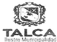
TABLA SESION EXTRAORDINARIA CONCEJO COMUNA DE TALCA

JUEVES 29 DE SEPTIEMBRE DE 2016 - 16:00 HORAS