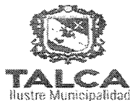
TABLA COMPLEMENTARIA SESION ORDINARIA CONCEJO COMUNA DE TALCA

MARTES 11 DE OCTUBRE DE 2016 - 16:00 HORAS