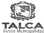
TABLA COMPLEMENTARIA SESION ORDINARIA CONCEJO COMUNA DE TALCA MARTES 07 DE AGOSTO DEL 2018 - 17:00 HORAS