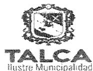
TABLA COMPLEMENTARIA SESION ORDINARIA CONCEJO COMUNA DE TALCA MARTES 21 DE AGOSTO DEL 2018 - 17:00 HORAS