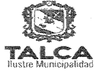
TABLA COMPLEMENTARIA SESION ORDINARIA CONCEJO COMUNA DE TALCA MARTES 21 DE AGOSTO DEL 2018 - 17:00 HORAS