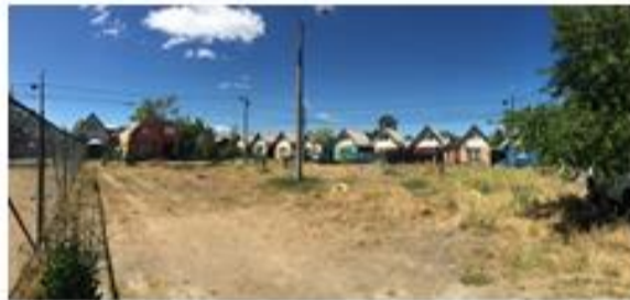
IMAGEN SITUACION ACTUAL