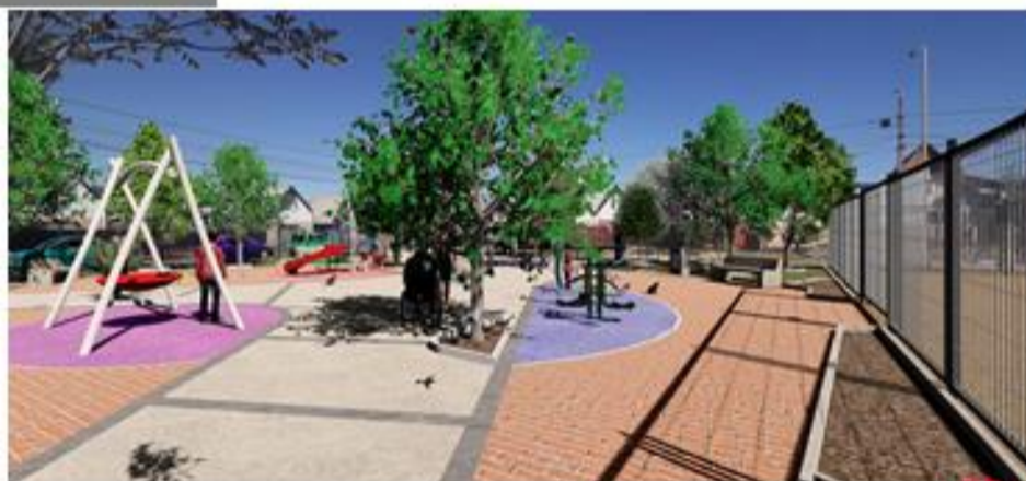
IMAGEN DEL PROYECTO

COMPLEJO INCLUIVO - MAQUINAS DE EJERCICIO