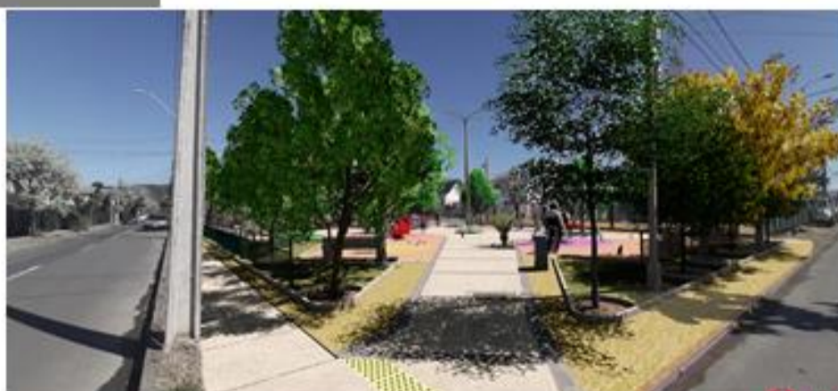
IMAGEN DEL PROYECTO

OBRA: MEJORAMIENTO AREA DE EQUIPAMIENTO SAMUEL LILLO, TALCA