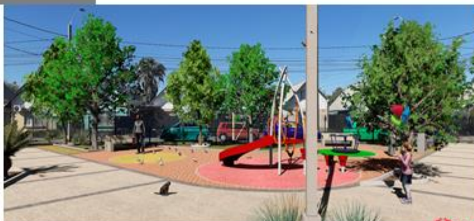
IMAGEN DEL PROYECTO

OBRA: MEJORAMIENTO AREA DE EQUIPAMIENTO SAMUEL LILLO, TALCA